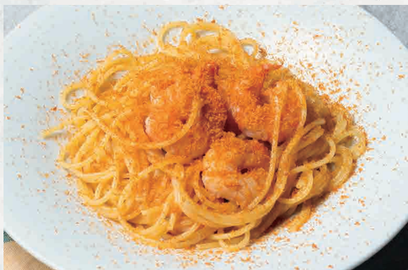
天然海老と カラスミのパスタ 1600 Natural shrimp & mullet pasta