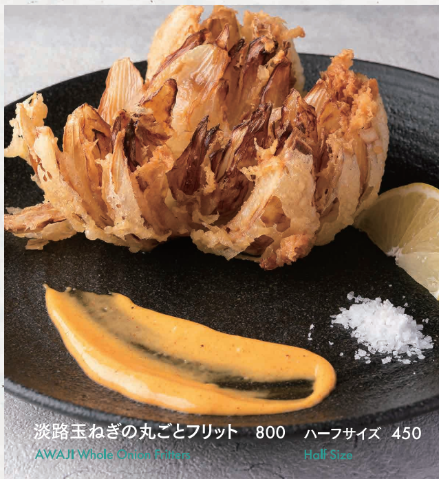
淡路玉ねぎの丸ごとフリット 800 ハーフサイズ 450 AWAJI Whole Onion Fritters Half Size