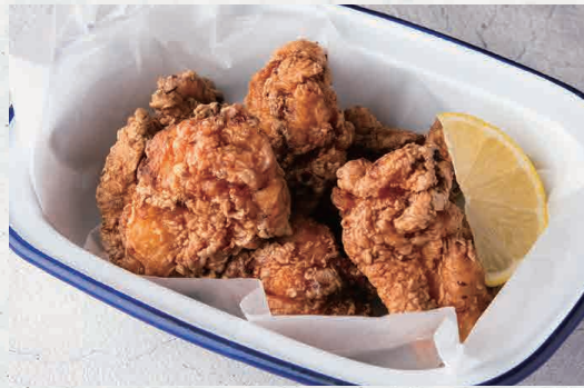
スパイシーチキンフリット 700 Spicy Chicken Fritters