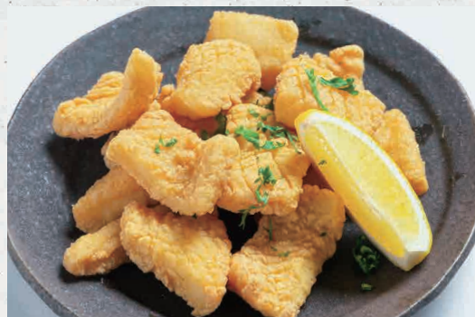
イカのセモリナ粉フリット 650 Squid Frit with Semolina Powder