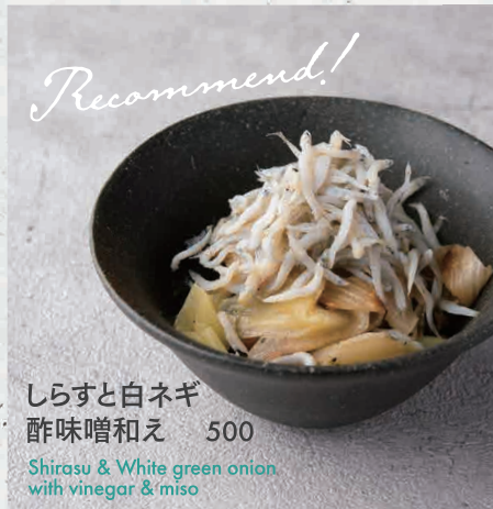
しらすと白ネギ 酢味噌和え 500 Shirasu & White green onion with vinegar & miso