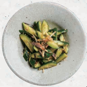
たたき胡瓜 Cucumber 450