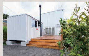
ウォールドヴィラ WALLED VILLA