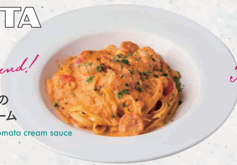
天然海老の トマトクリーム 1600 Shrimp with tomato cream sauce