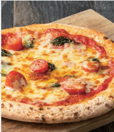
マルゲリータ 1100 [トマト・バジル・モッツアレラ] Margherita