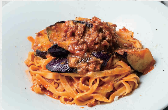
牛すじのボロネーゼ 1400 生タリアテッレ Fresh Tagliatelle Bolognese