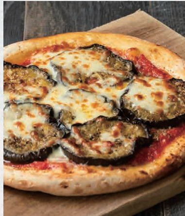
ピカンテサラミと 米茄子のピッツァ 1350 Picante Salami & Eggplant Pizza