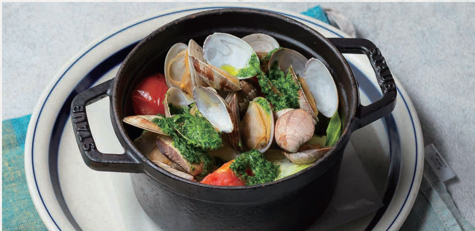
あさりとキャベツ白ワイン蒸し 1200 Steamed clams & cabbage in white wine