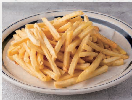
ポテトフライ 各 550 French Fried