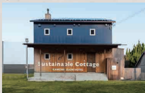
サスティナブルコテージ Sustainable Cottage