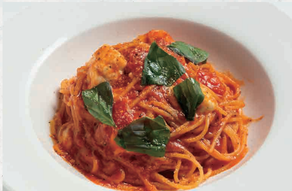
チーズたっぷりポモドーロ 1200 Cheese Pomodoro