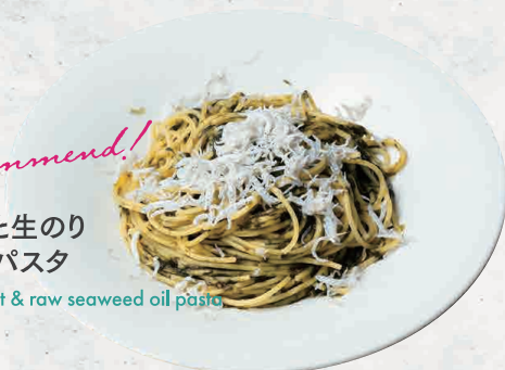
しらすと生のり オイルパスタ 1350 Whitebait & raw seaweed oil pasta