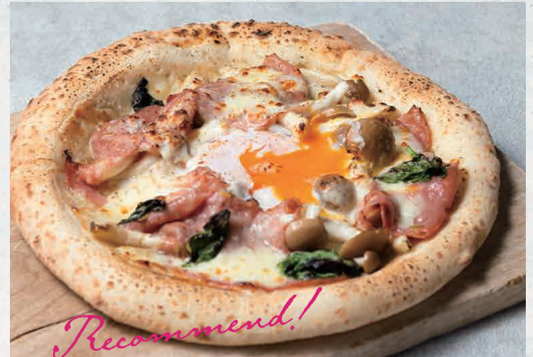
モルタデッラと半熟卵のピッツァ 1400 Mortadella & soft-boiled egg pizza