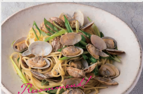
あさりと九条ネギの ボンゴレビアンコ 1350 Clam & green onion Vongole Bianco