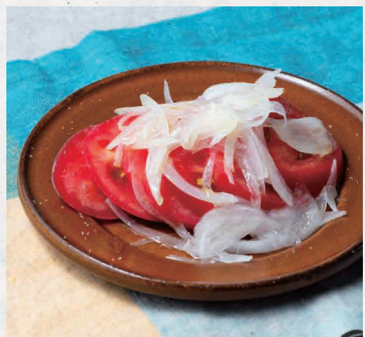
トマトの白バルサミコ酢マリネ 550

Tomatoes marinated in white balsamic vinegar