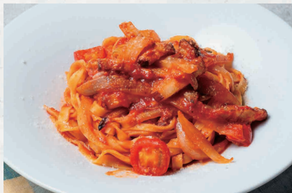
アマトリチャーナ 1350 Amatriciana