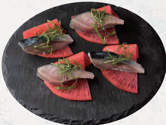
瞬間 シメ鯖 紅芯大根 780