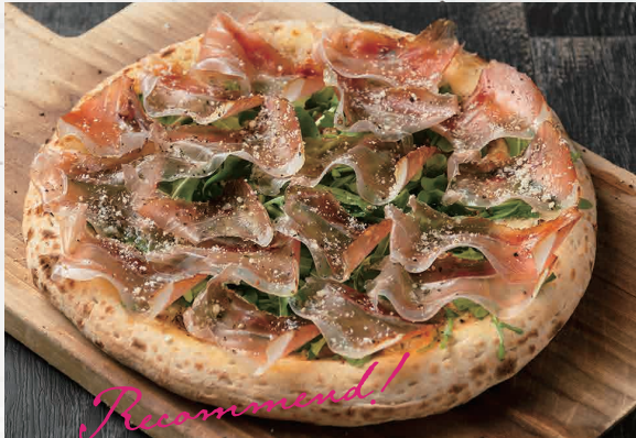
生ハムとルッコラのピッツァ 1450 Prosiute Rucicola