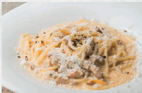
カルボナーラ 1450 Carbonara