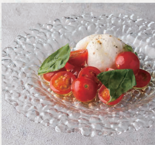
ブルータチーズのカプレーゼ 950