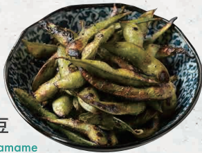
焼き枝豆 Grilled Edamame 500